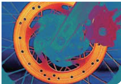
オートバイのディスクブレーキシステム