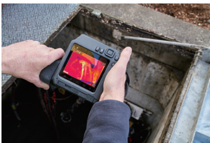
最大161,472ピクセルの高解像度