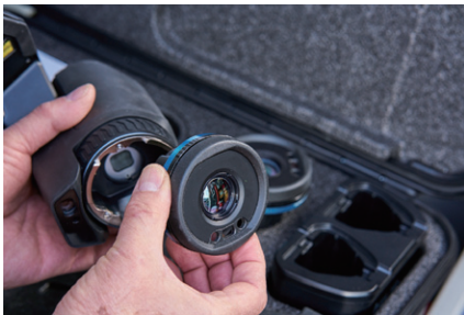
AutoCal™ 光学によりシリーズの全カメラでレンズ (広角から望遠) の共有が可能