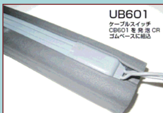
UB601 ケーブルスイッチ CB601 を発泡 CR ゴムベースに組込

発泡ゴムのクッションベースに山武商会の感圧スイッチシリーズ「ケーブルスイッチ CB601」を組み付けた製品 例：8m × 2 式