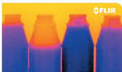
不透明ボトルの液量を検出