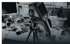
タイムラプス撮影 (E96)