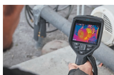
高視野角 高輝度IPS液晶