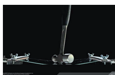
耐衝撃液晶ディスプレイ採用