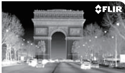
凱旋門の熱画像 - フランス、パリ