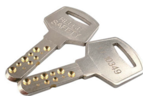
表裏対称形状のディンプルキー (パドロックに 1 本付属)