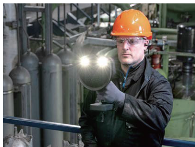
暗所の作業に強い作業用LED