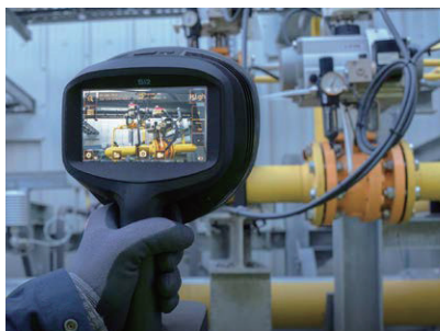
鮮明な画像で検査時間短縮